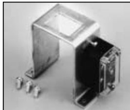
L4.78227.E Safety switch Sicherheitsschalter