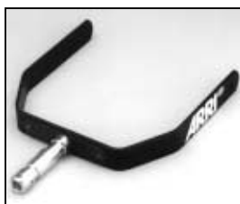
L4.78211.E Stirrup compl. Haltebügel kpl.