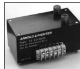
L4.77530.E Ignitor Zündgerät