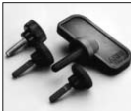
L4.78112.E Knob set Rändelschrauben-Set