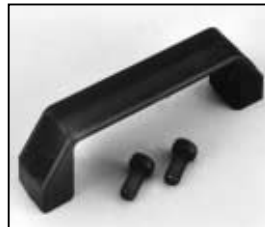
L4.78107.E Rear handle Griff