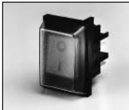
L4.72826.E On/Off switch Wippschalter