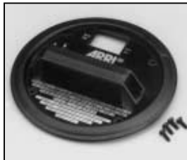
L4.78238.E Cover compl. Discontinued ! Deckel kpl. Nicht mehr verfügbar !