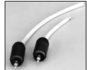
L4.78111.E H. T. cables Lampenkabel