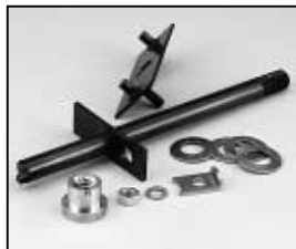
L4.77604.E Lamp lock lever Hebel geschweißt