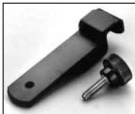
L4.78113.E Top latch Verschlusshebel