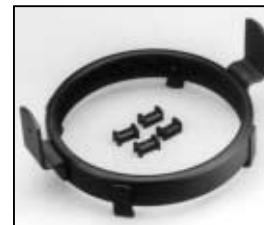
L4.78206.E Barrel ring Discontinued! Lauffring kpl. Nicht mehr verfügbar!