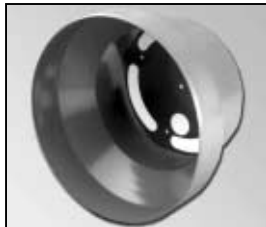
L4.78123.E Housing Discontinued! Leuchtgehäuse Nicht mehr verfügbar!

NOTE: WHEN ORDERING QUOTE PART NUMBER BEMERKUNG: BEI BESTELLUNG IDENT.-NR. ANGEBEN