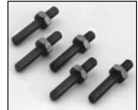
L4.78103.E Safety switch plungers (5 pcs.) Schaltstift-Set (5 Stück)