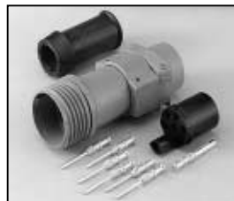
L4.75604.E Schaltbau connector with traction relief Schaltbau Stecker mit Zugentlastung