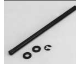
L4.78102.E Door hinge bolt Scharnierbolzen