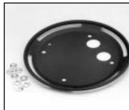
L4.78199.E Guide ring Führungsring