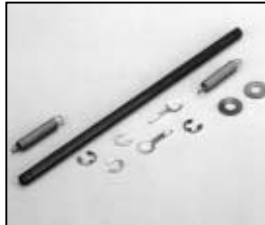
L4.78184.E Guide rail Gleitstange