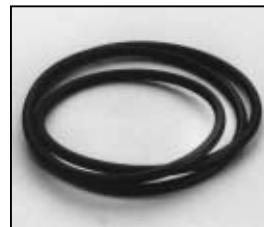
L4.77643.E O-Ring O-Ring