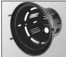
L4.78181.E Internal housing Discontinued! Innengehäuse Nicht mehr verfügbar!