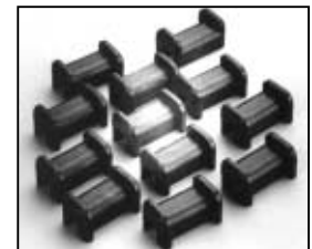
L4.78061.E Rotation guides (12 pcs.) Gleitstücke (12 Stück)