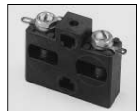
L4.75788.E Spark gap Funkenstrecke