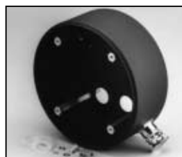
L4.78226.E Ignitor housing Discontinued! Zündergehäuse Nicht mehr verfügbar!