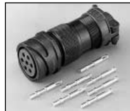
L4.71876.E Veam connector (Female) Veam Stecker (Buchsenkontakt)