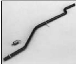
L4.78101.E Safety switch activator Discontinued! Schaltstange Nicht mehr verfügbar!