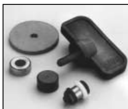
L4.78221.E Stirrup mounting set Bügelbefestigungs-Set