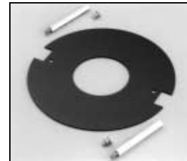
L4.78109.E Heat shield Lampenblech