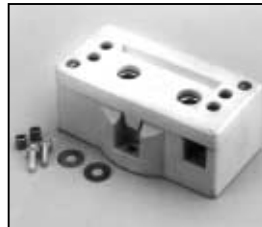
L4.78183.E Lampholder Lampenfassung