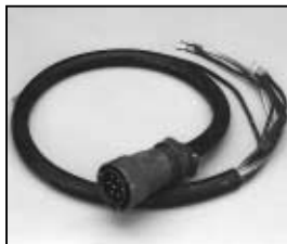
L4.75888.E Mains cable (Veam) Discontinued ! Scheinwerferkabel (Veam) Nicht mehr verfügbar !