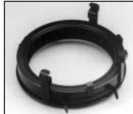
L4.77650.E Hinged door with accessory bracket Gleitring