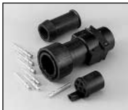
L4.75602.E Schaltbau connector (Male) Schaltbau Stecker (Stiftkontakt)