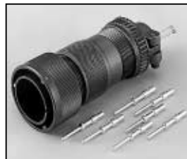
L4.71874.E Veam connector (Male) Veam Stecker (Stiftkontakt)