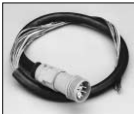
L4.78249.E Mains cable (Schaltbau) Discontinued ! Scheinwerferkabel (Schaltbau) Nicht mehr verfügbar !