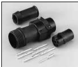
L4.75603.E Schaltbau connector (Female) Schaltbau Stecker (Buchsenkontakt)