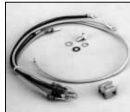
L4.78251.E Connecting wire compl. Discontinued ! Verbindungsleitungen kpl. Nicht mehr verfügbar !